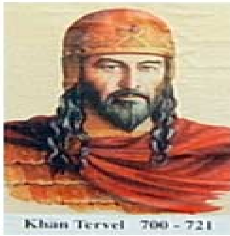
Khan Tervel 700 - 721