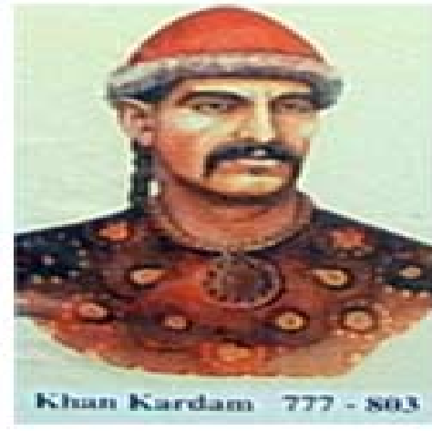
Khan Kardam 777 - 803