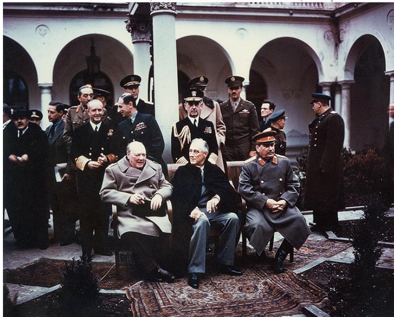
Churchill, Roosevelt & Stalin at the Yalta Conference, February 1945

сили - Англия, Франция, Германия, Русия, Америка. Ясно е, че те никога не са имали и най-малк