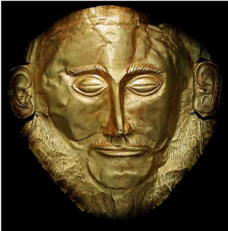
Маската на Агамемнон в Грндолла е с египетска форма. Направена е от злато, което е нахувано в Ада тепе.

▣ Маската на Агамемнон. Предполага се, че е направена от златните находища на Ада тепе