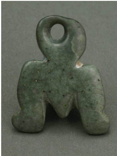
Идолна пластика, намерена в Русенската селищна могила

В праисторическия фонд на музея в Русе се съхраняват повече от 7000 находки от периода 8000