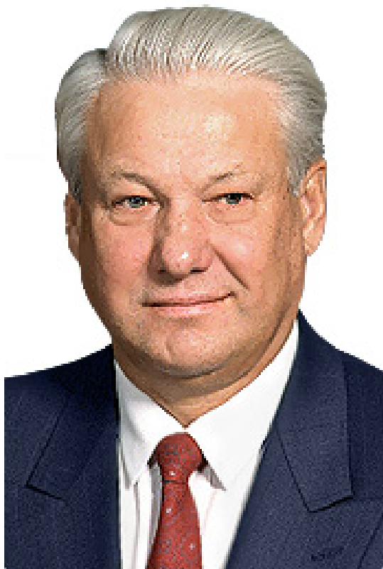
Борис Николаевич Елцин

Акад. Рахимов разказва, че през април 2000 г., обединени от търсенето на корена си, учени от р