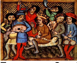
Те пееха за Сватбата на Царския Син.

И аз ги слушах. То бе музика на богове — и тъмни, звънтящи слова на сфинкс. И аз ги слушах. Николай Райнов, Богомилски легенди