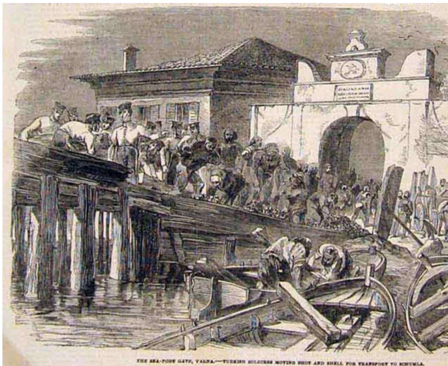
3. Варна - пристанищната порта

В гасенето на пожара се включват френските инженерни части и алжирските зуави, генерал Б