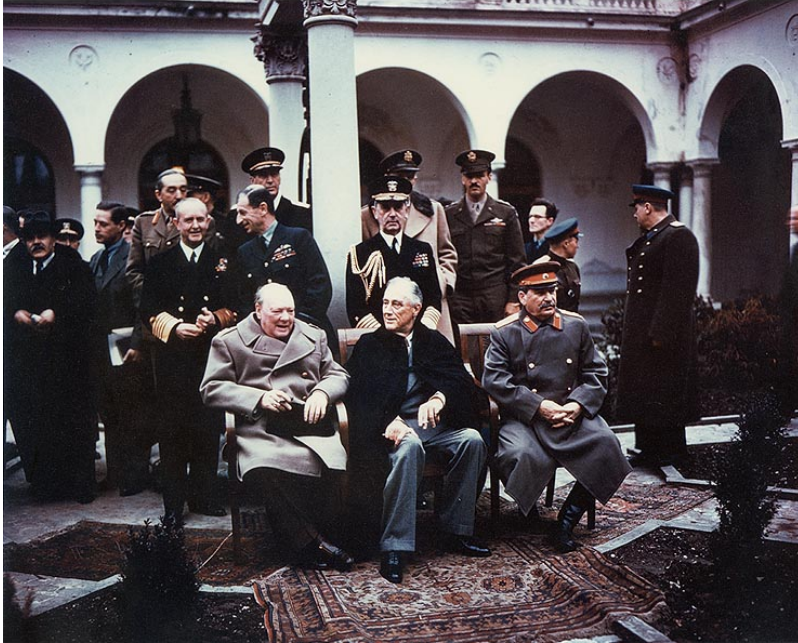
Photo # USA C-543 Churchill, Roosevelt & Stalin at the Yalta Conference, February 1945

сили - Англия, Франция, Германия, Русия, Америка. Ясно е, че те никога не са имали и най-малк