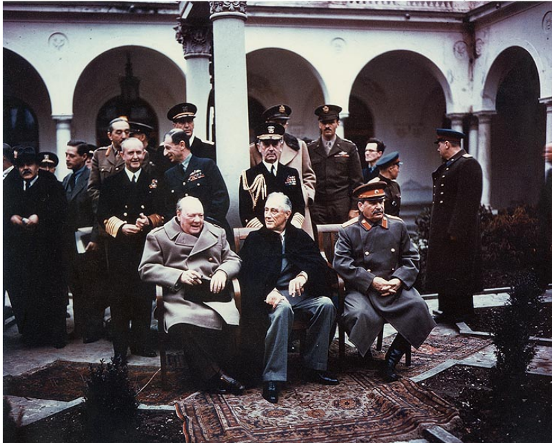
Photo # USA C-543 Churchill, Roosevelt & Stalin at the Yalta Conference, February 1945

сили - Англия, Франция, Германия, Русия, Америка. Ясно е, че те никога не са имали и най-малк