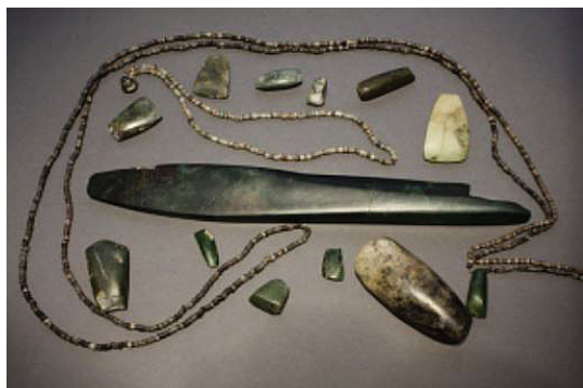
Колекция от нефрит в италиянския музей в Перник, която е отобличава дълга ера поставяне

Теорията на археоложката Анета Бакъмска е , че вероятно нефритени находища е имало на Ба