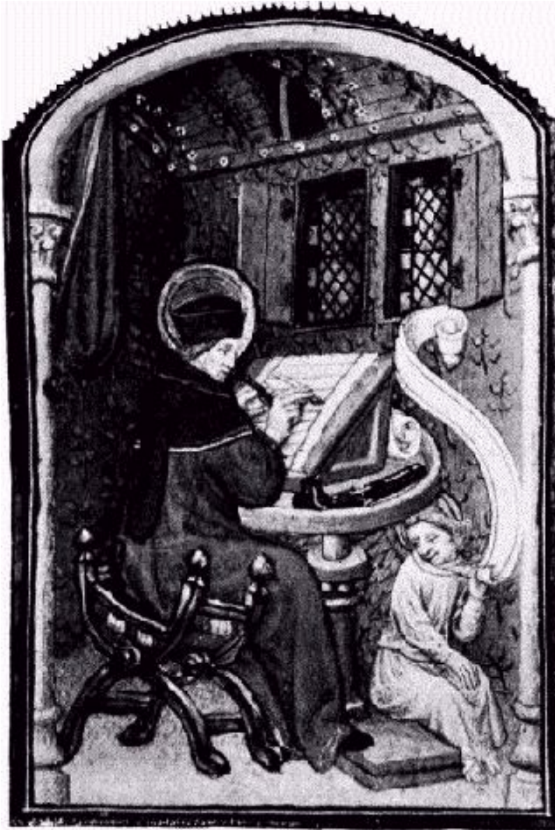
Saint Matthew in a domestic „closet or idealised scriptorium. (Book of Hours, Paris, c 1420 (British Libra

За значението и важността на манастирския комплекс говорят мащабите на строителството му -